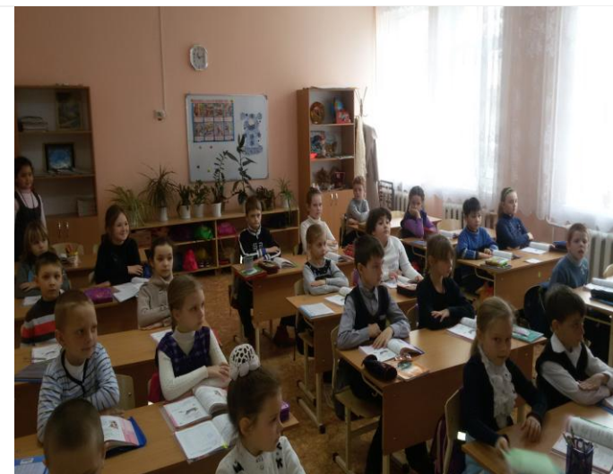
Размещение в классах уголков безопасности школьников, гражданской защиты населения